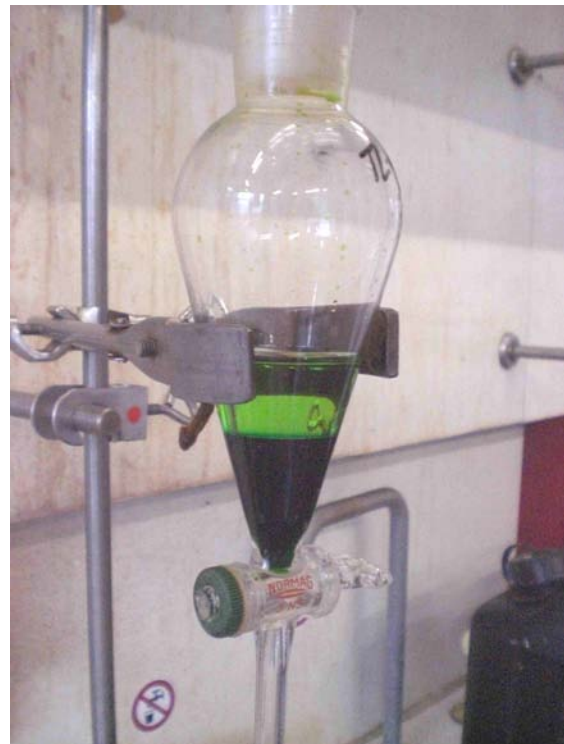
Abb. 6: Schütteltrichter mit grünem Gemisch/ obere Petroleumbenzin-Phase