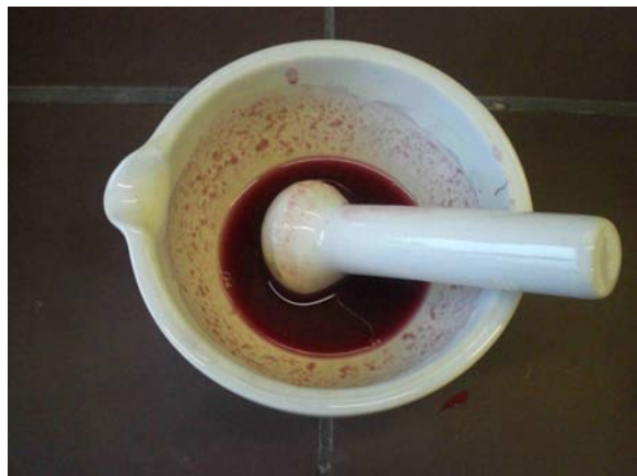
Abb. 2: Nach dem Mörsern