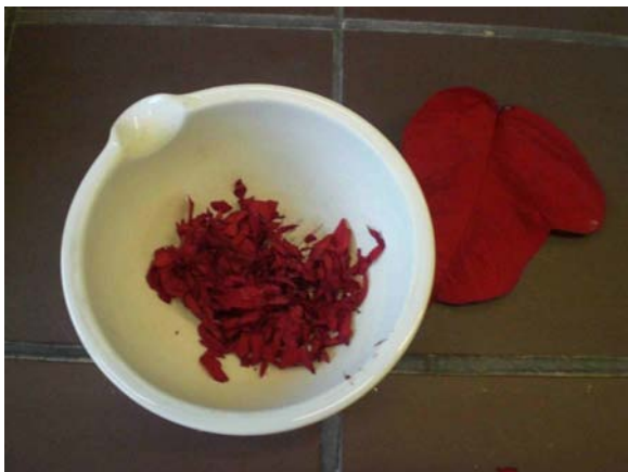
Abb. 1: Rote Blätter im Mörser

Das Ergebnis war ein dünnflüssiges rotes (s. Abb. 2) bzw. grünes (s. Abb.4) Gemisch.