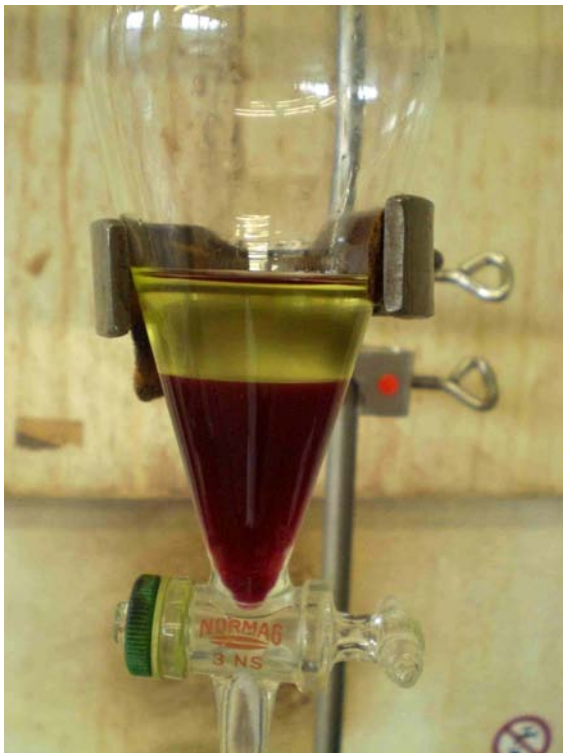
Abb. 5: Schütteltrichter mit rotem Gemisch/ obere Petroleumbenzin-Phase

Der Vorgang wurde mit dem grünen Gemisch wiederholt. Abschließend zeigte sich hier in der oberen Phase eine grünliche Verfärbung (s. Abb. 6).