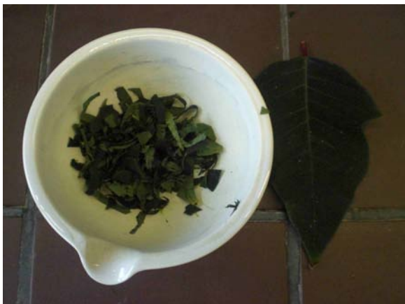
Abb. 3: Grüne Blätter im Mörser