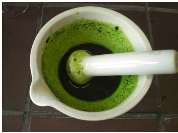
Abb. 4: Nach dem Mörsern