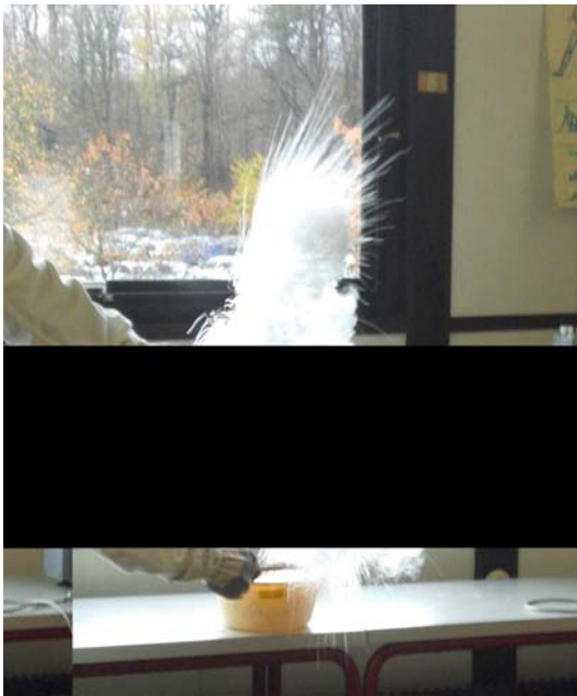
Abbildung 1: Herausschießendes Wachs – keine Entzündung

Bei nicht ausreichender Erhitzungsdauer trat keine Entzündung des Waxes auf (Abbildung 1).