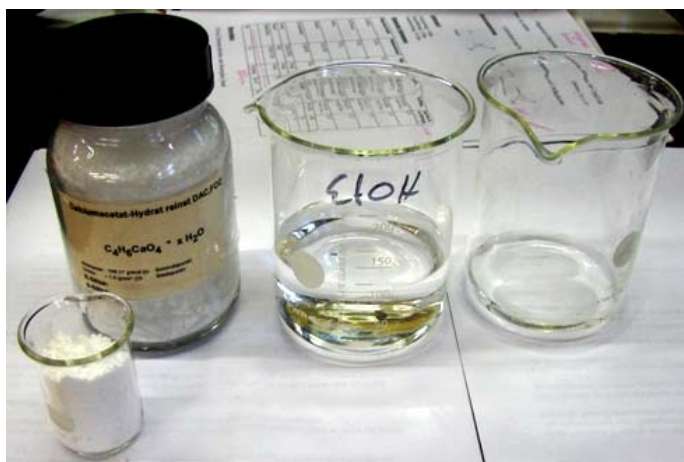
(oben: Ausgangsubstanzen für die Gelherstellung)

Man löst 6 g Calciumacetat in 20 mL Wasser und gibt diese Lösung in einem Schwung in die 100 mL Ethanol. Das entstandene Gel wird in die Porzellanschale gegeben und auf den Dreifuß mit Drahtnetz im Abzug entzündet. Um den Versuch etwas interessanter zu gestalten, kann man noch die unterschiedlichen Metallsalze und Alkalimetalle auf das brennende Gel geben.