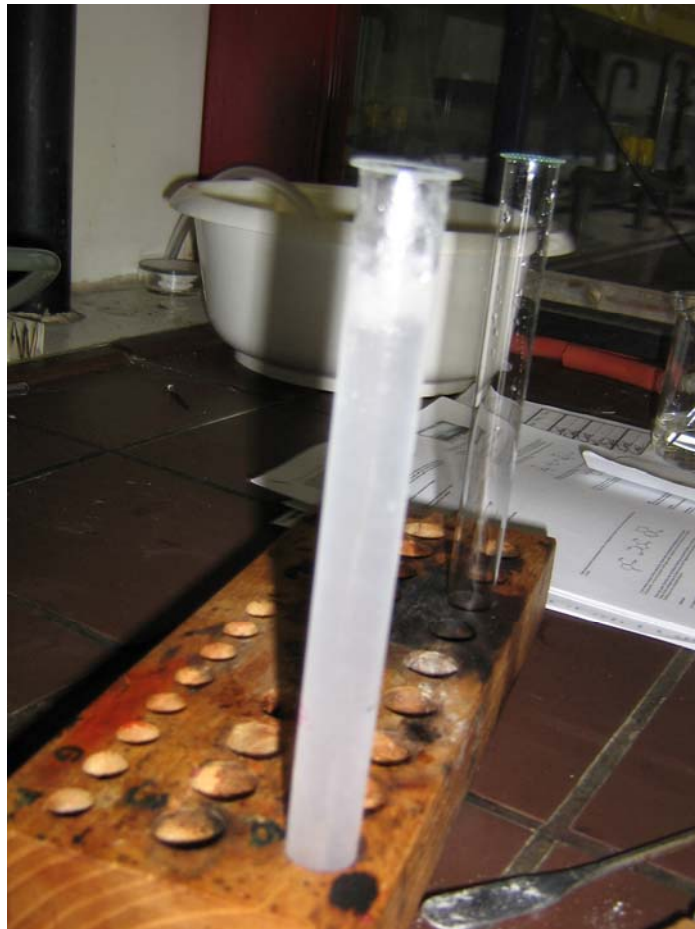
Esterschicht oben im Reagenzglas