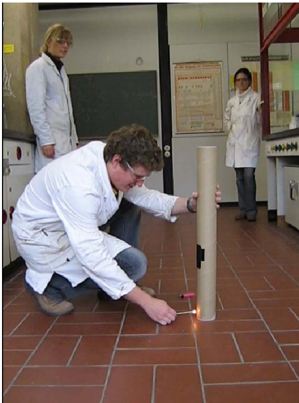
kurz vor der Zündung