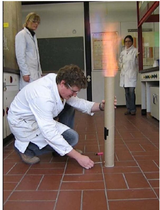
im Moment der Explosion